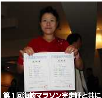
第1回海峡マラソン完走証と共に

今、11月8日に開催される「下関海峡マラソン」に向けて、トレーニングをしています。