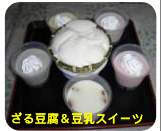
ざる豆腐&豆乳スイーツ

ホームページ http://www18.ocn.ne.jp/toufuya8/36.html