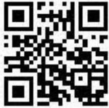
三阪歯科HP携帯QRコードです。是非アクセスして下さい

とが病気や老化を招く活性酸素を減らし、ストレス解消に役立つこと、血管の老化、脳の老化を防止に重要な働きをしていることがわかってきました。これからますます高齢社会になります。健康で生活できることが人生の質(QOL)を高めることにつながります。お口の中は体の中の問題より気づきやすい場所です。日々の食の注意と口腔環境の改善と定期健診で、予防をしていくことが重要です。そのために「阪歯科はスタッフ共々、努力していく所存です。情報発信としてホームページ(パソコン・携帯)を充実していきますのでご利用ください。