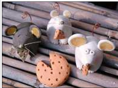
仁井田京子さん作

今年が開業30年目を迎えます。当時幼稚園生だった子がお母さんとして子供連れで来られたり、働き盛りだった方が現役を退かれ新たな人生の始まりを期して手入れに來られたりしています。私自身も病気で休んだことは1回もなく診療を続けることができたことを有り難く感じ、周りの方々に大変感謝をしています。