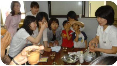
フッ素の効果 (卵での実験)

第1時間目では院長による虫歯や歯周病の原因・治療法についての歯科講話が行われました。悪くなってしまうところを治療することも大切ですが、それ以上に「なぜ悪くなってしまうのか」という原因を明らかにし、自覚して生活習慣を変えることで虫歯や歯周病にならないようにすることが大切だということを理解して頂けたのではないかと思います。