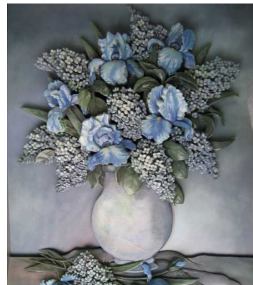
シャドーボックス 上野 加代子様