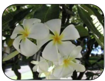
ブルメイラ 私の大好きな花