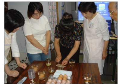
えっナイフで歯がきれるの？

◆歯については当院にかかって相だな知識を得ていたと思っていたが、今日はスライドや実験で更に知識をいただいた。