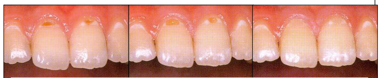
術前 感染歯質の除去 修復後

また、穴の開いた虫歯(再石灰化が期待できない感染歯質)となってしまうと出来るだけ小さなうちに虫歯の部分のみを削除し、再び虫歯にならないようにフッ素入りで歯に接着する性質の材料を用い修復します。その後は、毎日のセルフケアと定期的なプロケアにより虫歯の抑制を図ります。