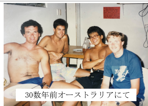
30数年前オーストラリアにて

ある日、お上品な?おじさまがミートパイを買いにきてくださり、その後ディナーのご予約もいただきました。その過程で色々とお話を聞きすると、同じ高校の大先輩