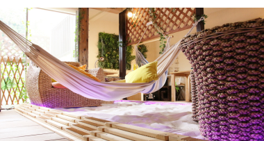
オーストラリアの白砂とウッドデッキ

あつ、オーストラリアの白砂とウッドデッキを敷き詰めた南国の癒しをご体感いただける『みーとぱいはうす』もよろしくお願ひします。