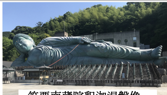
笹栗南蔵院釈迦涅槃像