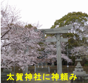
太賀神社に神頼み

人生の中でもう一つ気になることがあります。今冬のシーズンで初雪が2月、積雪を一度も経験しなかったことです。