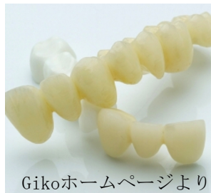
Gikoホームページより

費用: 詰め物 ¥30,000/被せ物(着色なし) ¥40,000 被せ物(着色付) ¥50,000/被せ物(高度着色) ¥60,000