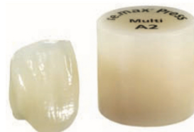
ivoclar社ホームページより

費用: 詰め物 ¥30,000/被せ物(着色なし) ¥50,000/ 被せ物(着色) ¥60,000