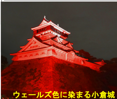
ウェールズ色に染まる小倉城