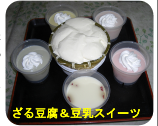
ざる豆腐&豆乳スイーツ

自分の味を分かって下さる方を大事にしていきたいという気持ち、並の豆腐屋で終わってしまふかという思いを持ち続けて9年間頑張ってきたそうです。その為には、お客様との会話で、顔・名前はもちろん好みや癖・個性等を覚えていく事が大切で、言葉の1つ1つにより思いやりや優しさが伝わるんですよ。こちらが勉強させて頂くという気持ちでしょうね。とお話下さいました。私自身が仕事をする上で1番大切な事を教えて頂いた様でしっかりと胸に刻んでおきたいと思ひます。