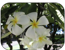
ブルメリア 私の大好きな花