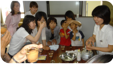
フッ素の効果（卵での実験）

第1時間目では院長による虫歯や歯周病の原因・治療法についての歯科講話が行われました。悪くなってしまうところを治療することも大切ですが、それ以上に「なぜ悪くなってしまうのか」という原因を明らかにし、自覚して生活習慣を変えることで虫歯や歯周病にならないようにすることが大切だということを理解して頂けたのではないかと思います。