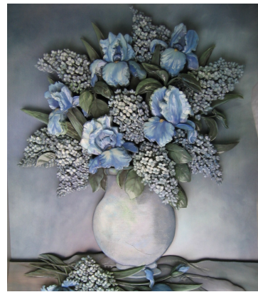
シャドーボックス 上野 加代子様