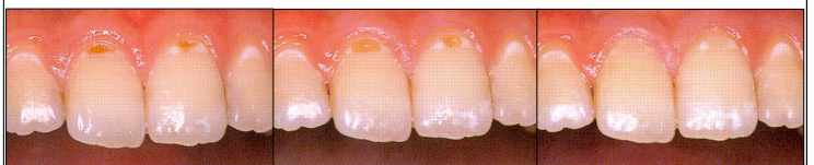
術前 感染歯質の除去 修復後

また、穴の開いた虫歯（再石灰化が期待できない感染歯質）となってしまうたら出来るだけ小さなうちに虫歯の部分のみを削除し、再び虫歯にならないようにフッ素入りで歯に接着する性質の材料を用い修復します。その後は、毎日のセルフケアと定期的なプロケアにより虫歯の抑制を図ります。