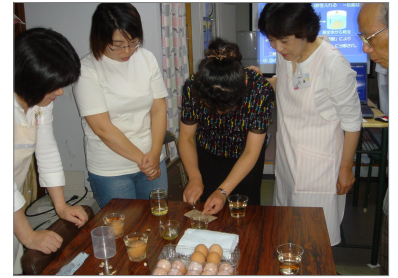
えっナイフで歯がきれるの？

◆スライドで様々な口の中の写真を見せて頂き、自分の歯を大事にしていかななくてはいけないと思った。年に2回の健診を受けているので安心して居る。毎日の健康に気をつけていきたい。普段は目にするのができないフッ素の効果も、卵を利用した実験で見ることが